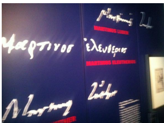
Επιγραφή στο σπίτι που γεννήθηκε ο Λούθηρος, στην πόλη Eisleben

Η επισήμανση: Ο ως άνω Μεταρρυθμιστής είναι γνωστός ως Μάρτιν Λούθηρος. Το όνομα Martin έλαβε κατά τη βάπτισή του στις 11 Νοεμβρίου 1483, εορτή του Αγίου Martin. Ελάχιστα γνωστό, ακόμη και σε Γερμανούς θεολόγους, αλλά και σε μας είναι αυτό, για το οποίο γράφεται το παρόν σημείωμα: Ότι δηλαδή εκτός από το Martin, ο Λούθηρος είχε επιλέξει αργότερα για τον εαυτό του και το όνομα Ελευθέριος (Eleutherios και όχι το εκλατινισμένο Eleutherius). Απαντάται μάλιστα εξελληνισμός και του άλλου ονόματός του: Martinus .